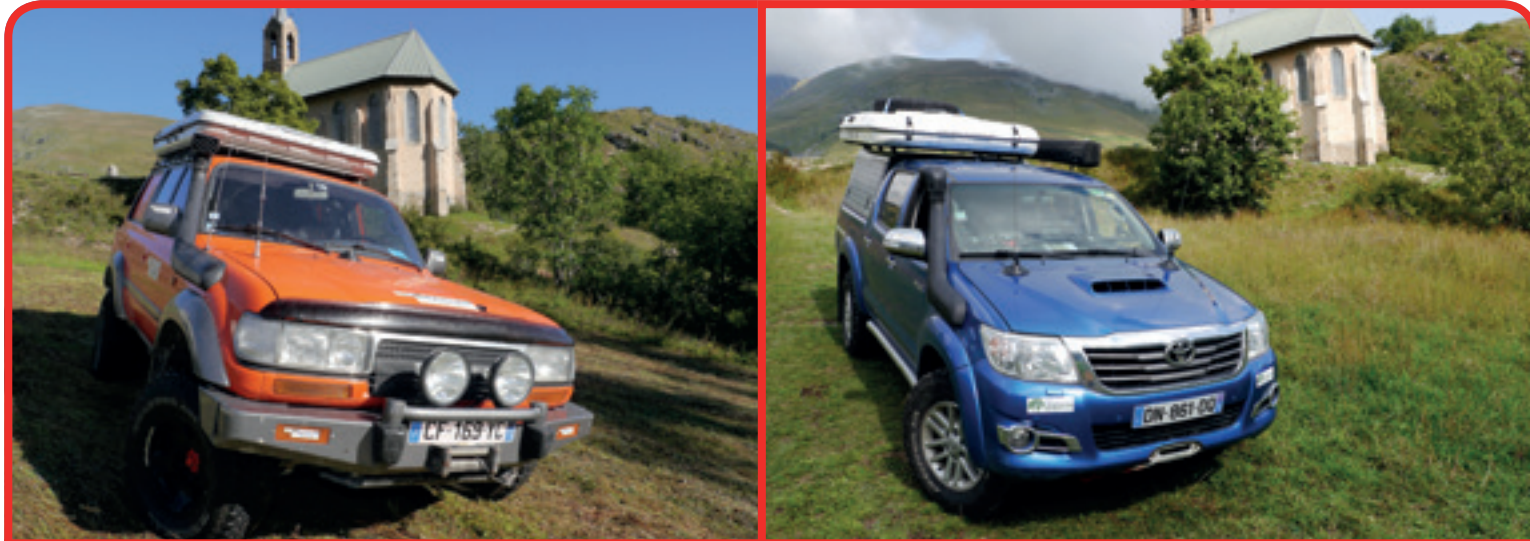
Toy un jour, Toy toujours ! La flotte de Globatlas comporte plusieurs Toy : un KDJ 120, un HDJ 80 et 2 Hilux. Depuis la création de l'agence, Bruno reste toujours fidèle à la marque nipponne. Autre signe de fidélité : tous ses Toy sont préparés par RSC 4x4 à Lyon, et toutes ses tentes de toit sont signées James Baroud.